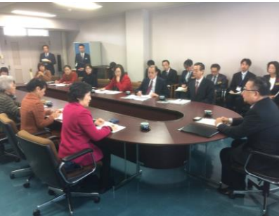
千葉副知事に要請する母親大会連絡会のみなさんと同席する県議団(11月20日)