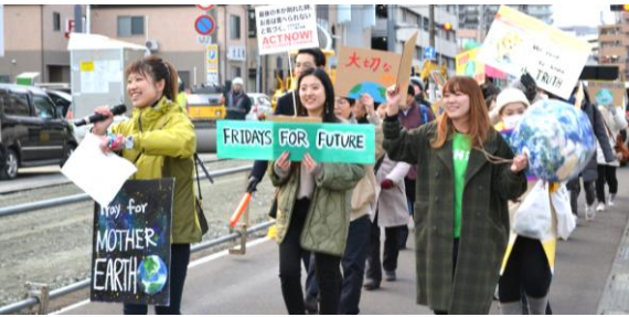
国連気候変動枠組み条約第25回締約国会議に向けたグローバル気候マーチが盛岡でも開催されました(11月29日)