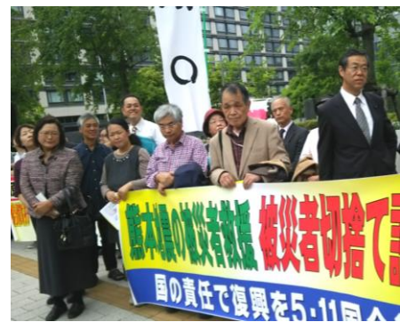
国会前行動に参加する県議団（5月11日）