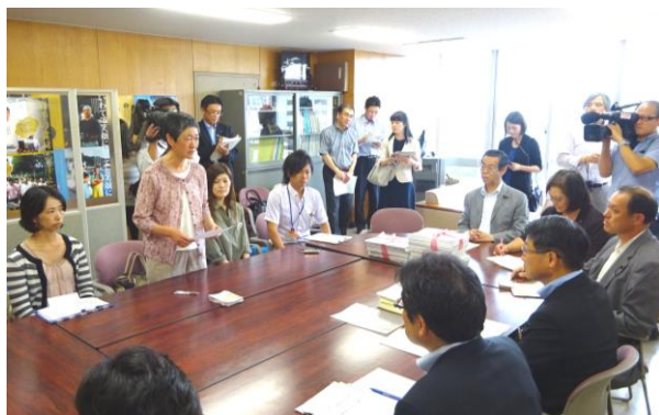
12911筆の署名とともに要請する会の方々（6月14日）

6月14日、子どもの医療費助成制度拡充を求める岩手の会が達増拓也知事あてに「子どもの医療費助成の拡充を求める」署名1万2911筆