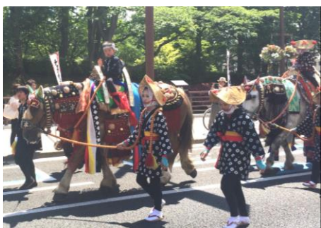
チャグチャグと鈴の音を響かせ歩く馬コ（6月11日・桜山神社前）