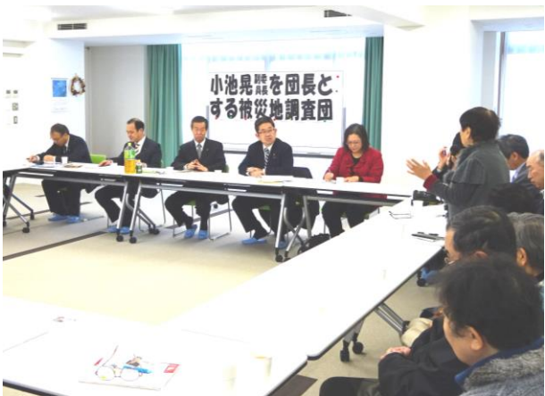
釜石市・大槌町の被災者から切実な要望を聞く(2月3日)

党県議団は2月10日、防災集団移転促進事業の住宅宅地の無償貸与措置の情報提供と対応を求める申し入れを行いました。被災者の住宅再建に大きな支援になるものであり、すでに東松島市で行われている具体例を関係市町村